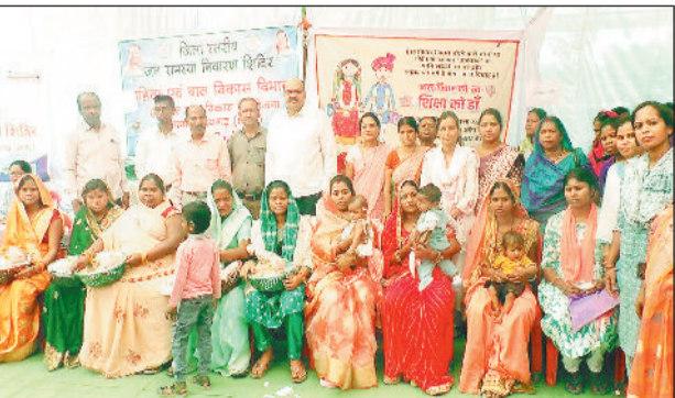
शिविर में विभिन्न विभागों द्वारा हितग्राहियों को योजनाओं से लाभान्वित किया गया।

गए। बड़ी संख्या में ग्रामीण अपनी समस्याओं के समाधान और विभिन्न योजनाओं का लाभ लेने के लिए शिविर में पहुंचे। कई मामलों में मौके पर ही निराकरण कर हितग्राहियों को राहत प्रदान की गई। महिलाओं, युवाओं और समाज के सभी वर्गों के हितों को ध्यान में रखते हुए विभिन्न योजनाओं का प्रभावी क्रियान्वयन किया जा रहा है। उन्होंने कहा कि जिला स्तरीय शिविर में सभी विभागों के अधिकारी एक ही मंच पर उपस्थित रहते हैं जिससे कई ऐसे कार्य जो सामान्यतः जिला मुख्यालय जाकर कराने पड़ते हैं, वे यहीं आसानी से संपन्न हो जाते हैं। उन्होंने लोगों से शिविर का अधिक लाभ उठाने की अपील की।