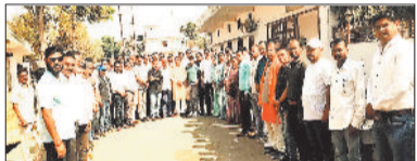
सोनगरा/बिश्रामपुर। संगठन को धार देने और आगामी चुनौतियों के लिए बृथ स्तर तक तैयार करने के उद्देश्य से सलका ब्लॉक कांग्रेस कमेटी की बैठक बतरा में संपन्न हुई।