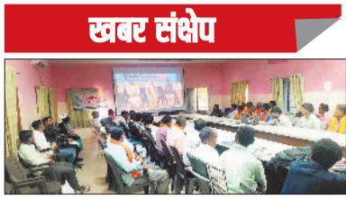
प्रधानमंत्री किसान सम्मान निधि की 22वीं किस्त जारी, सूरजपुर के किसानों को मिले 20.13 करोड़

सूरजपुर। प्रधानमंत्री नरेंद्र मोदी ने आज गुवाहाटी असम में आयोजित किसान सम्मेलन से प्रधानमंत्री किसान सम्मान निधि योजना की 22वीं किस्त का ऑनलाइन अंतरण किया। प्रधानमंत्री ने देशभर के 2,47,14,98 लाख किसानों के खातों में लगभग 498.83 करोड़ रुपये की राशि सीधे हस्तांतरित की गई। जिले के 1 लाख 129 किसानों के आधार सीडीई बैंक खातों में 20.13 करोड़ रुपये की राशि अंतरित की गई, जिससे किसानों में हर्ष का वातावरण है। प्रधानमंत्री किसान सम्मान निधि योजना अंतर्गत पात्र किसानों को प्रतिवर्ष तीन समान किस्तों में प्रत्येक चार माह पर 2 हजार रुपये की दर से कुल 6 हजार रुपये वार्षिक सहायता राशि दी जाती है। यह राशि किसानों को कृषि आदान सामग्री क्रय करने एवं कृषि कार्यों में सहयोग के लिए प्रत्यक्ष लाभ अंतरण के माध्यम से सीधे खाते में भेजी जाती है। 22वीं किस्त के अवसर पर सरगुजा, सूरजपुर एवं कृषि विज्ञान केंद्र के संयुक्त तत्वाधान में कृषि विज्ञान केंद्र अजिमा में जिला स्तरीय किसान सम्मेलन का आयोजन किया गया। कार्यक्रम में सांसद सरगुजा चिंतामणी महाराज मुख्य अतिथि के रूप में उपस्थित रहे। सूरजपुर के सभी 6 विकासखंडों में वरिष्ठ कृषि विकास अधिकारियों के कार्यक्रमों में स्थानीय जनप्रतिनिधियों एवं किसानों की उपस्थिति में प्रोजेक्टर व लैपटॉप के माध्यम से किस्त अंतरण का लाइव टेलीकास्ट दिखाया गया। प्रत्येक विकासखंड स्तर पर लगभग 50-60 किसान उपस्थित रहे, जबकि ग्राम पंचायत एवं सरकारी समिति स्तर पर 40 कृषक सम्मिलित हुए।