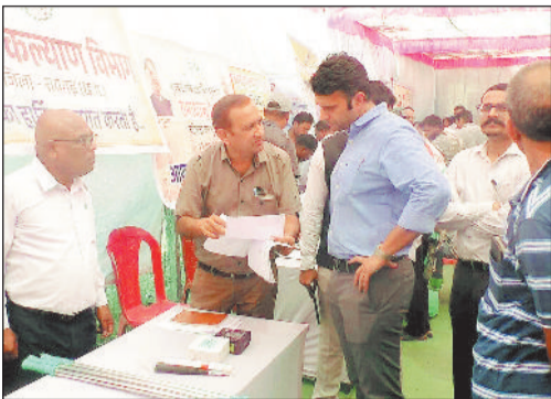
स्टॉल का निरीक्षण करते कलेक्टर।