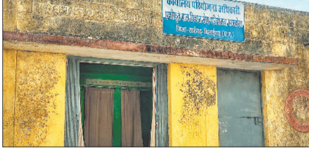
भेजी गई है जानकारी